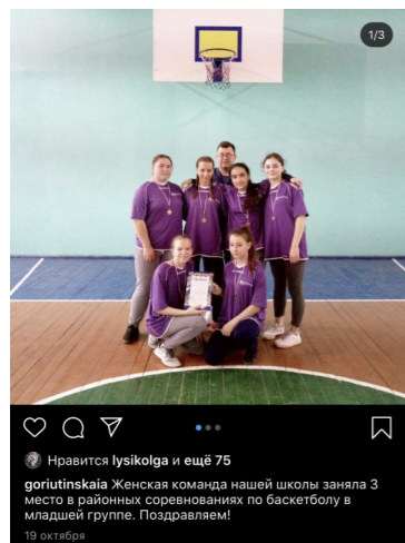
Комплект фото с награждения женской баскетбольной команды школы.

На сегодня самая популярная запись от 19 октября: